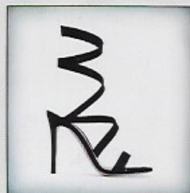
5 Sophie Gaudet