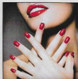
3 Constance Benquo