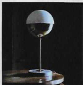
7 Chantal Levy