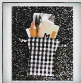
4 Charlotte Hugnet